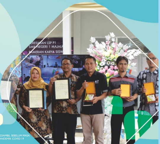
FOTO DIAMBIL SEBELUM MASA PANDHEK COVID 19